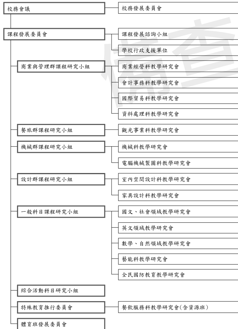
課程發展組織架構圖