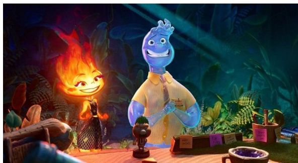
圖片 | 《元素方城市》劇照